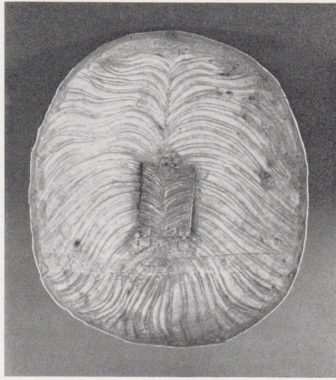
Reliekbouder. Het bovendeel van de schedel van binnen gezien

De gegraveerde versiering van de halsketting is gevuld met een ondoorzichtige glaspasta in rood en zwart. Het toegepunte wapenschild, dat er het sluitstuk van vormt, is schuin gedeeld in velden van eveneens ondoorzichtige kleuren. Het bovenste veld van keel is beladen met een gouden zespuntige ster; het onderste veld is tamelijk grof geruigd en stellig niet bedoeld om gezien te worden, maar om een waarschijnlijk zwarte glaspasta aan te brengen. Deze is verdwenen zonder enig spoor achter te laten. Het wapen is tot op heden nog niet geïdentificeerd. De wapens van de families Zorn uit Straatsburg, van Von Hewen uit de omstreken van het meer van Constanz en van Bubenbergh uit Bern die een dergelijke ster dragen zijn niet schuin doch recht gedeeld en de kleuren zijn anders. Een wapen van dezelfde indeling als dat van de kop van de H. Thekla 'schuin gedeeld keel en sinopel, het eerste beladen met een gouden ster' komt voor op het miniatuur met de Hertog van Brabant in het beroemde handschrift der 'Minnesaenger' dat aan Manesse wordt toegeschreven en dat in Zurich zou zijn ontstaan omstreeks het jaar 1300. Het gaat hier om blz. 18 van dit boekwerk, dat in de bibliotheek van Heidelberg wordt bewaard. Maar daar het wapen aan een tegenstander van de hertog toebehoorde, die als deelnemer aan de strijd wordt afgebeeld, blijft het helaas onbekend.