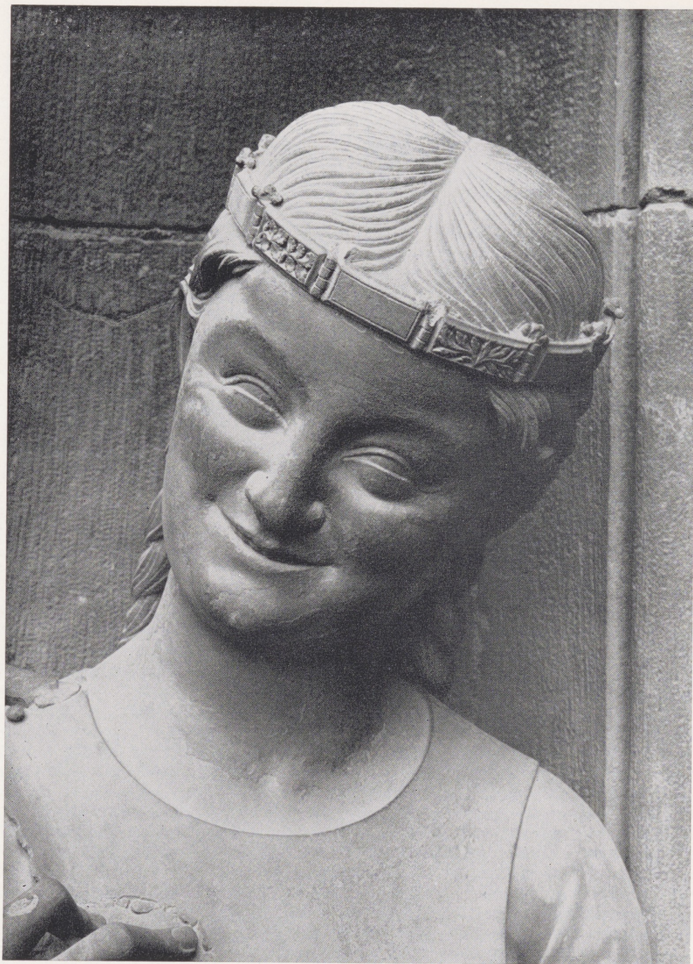
Straatsburg, ca. 1290, De eerste van de serie dwaze maagden. Zuidportaal aan de frontzijde van de kathedraal