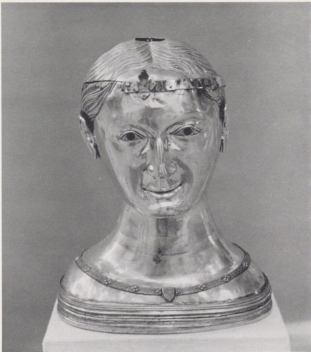
Bazel einde XIIIe eeuw, Zilveren reliekbouder van de heilige Thekla

was er nl. op uit om afgietsels te vervaardigen van oude beeldhouwwerken. Op deze wijze kon het stuk in 1838 voor 766 francs en 2 centimes worden verkocht aan kolonel Theubet de Porrentruy. Op de veiling te Liestal had hij reeds het beroemde gouden altaarantependium verworven dat, volgens de overlevering, geschonken was door de H. keizer Hendrik II ter gelegenheid van de inwijding in 1019 van de Munsterkerk te Bazel. Tegenwoordig wordt het bewaard in het Cluny-museum te Parijs. In 1842 publiceerde Theubet een brochure waarin zich een afbeelding bevond van het borstbeeld van de H. Thekla, staande op de oude houten en gebeeldhouwde