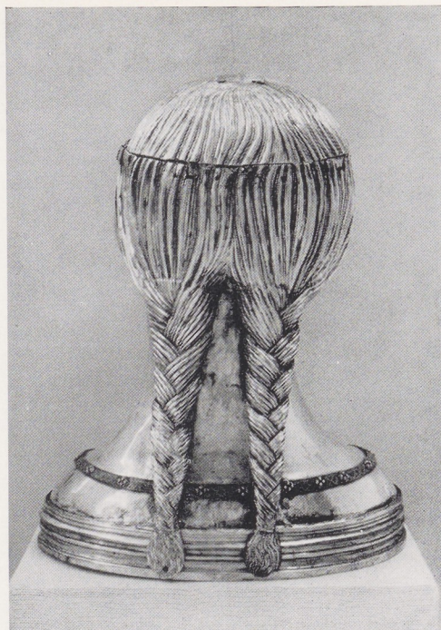
Reliekbouder, van achteren

toegang nodig had. Waarschijnlijk heeft men toen de bovenkant van het hoofd doorgesneden en er een deksel van gemaakt door aan de binnenkant een opstaande rand met klinknagels er aan te bevestigen: deze kunstbewerking kon onopgemerkt geschieden omdat de nieuwe snede verborgen bleef achter de met bloemetjes versierde diadeem waarvan helaas nog maar enkele brokstukken aanwezig zijn. De oren werden er naderhand weer aan vast gemaakt. De vlechten, die uit een vlakke strook tot een holle buisvorm zijn gebogen en van een ingedreven detaillering werden voorzien hebben van binnen een houten versterking en zijn door soldering aan de kop bevestigd. Het onderste uiteinde van een der vlechten, dat had losgelaten, is door middel van een klinknagel weer vastgezet.