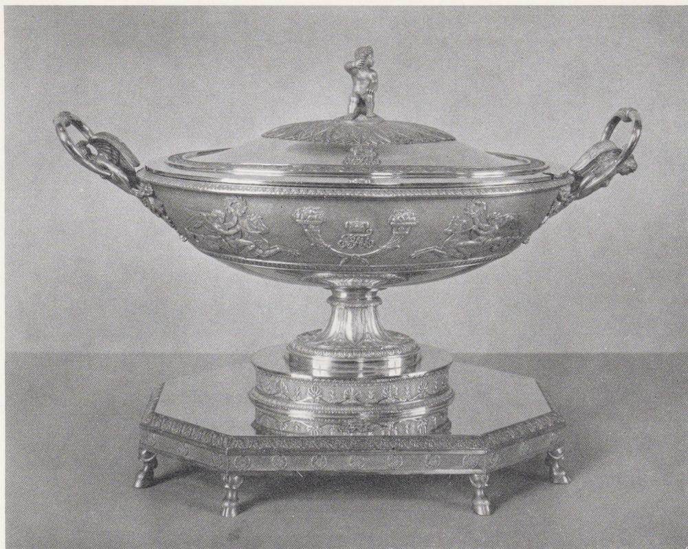
Dekschaal van het servies van Maria Feodorowna