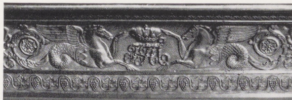
Randmotief van het presenteerblad van het servies van Maria Feodorowna