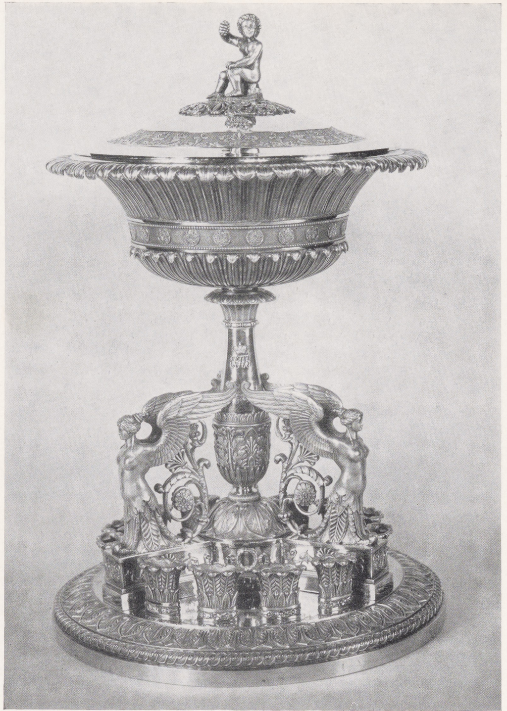
Confiture-schaal van het servies van Maria Feodorowna