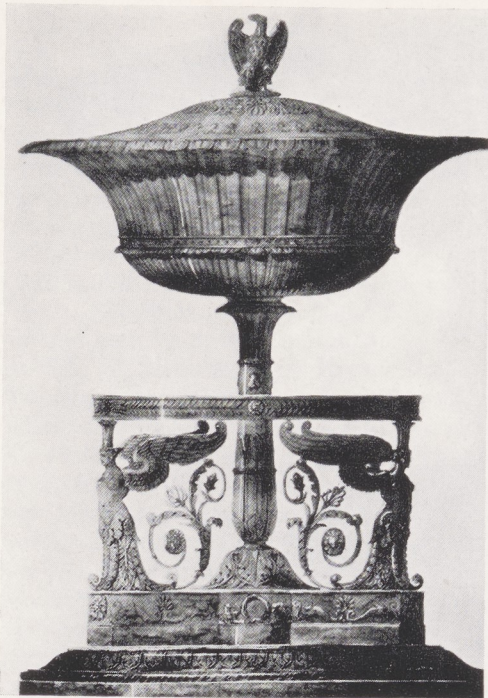
Tekening toegeschreven aan Percier. Paris, Bibliothèque du Musée des Arts Décoratifs