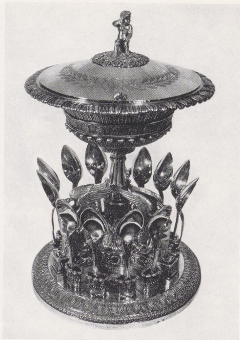
Confiture-schaal van het servies van Koningin Hortense. Musée du Louvre

berusten, te raadplegen. Zij bevatten misschien wel nadere gegevens, o.a. de prijzen der verschillende delen van het servies der Keizerin.