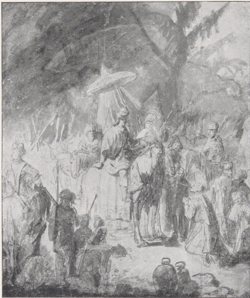
Afb. 1. Rembrandt, circa 1625-1629. Smeekbede gericht tot een veldbeer (Coriolanus?) . Tekening