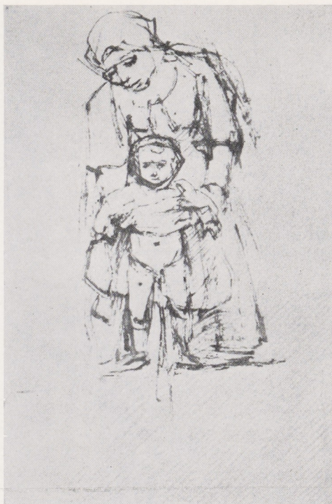
Afb. 5. Rembrandt, 1656. Moeder en kind. Pentekening in het Prentenkabinet te Dresden

en waarin op overeenkomstige wijze grote gedeelten rondom de helder verlichte hoofdfiguren in het donker zijn gehouden. Vooral de zware mantel van den knielenden koning vertoont een modelé, dat – in de trant van den David, die het hoofd van Goliath aan Saul brengt – haast geboetseerd lijkt in de vette verf; het op de zoom geborduurd patroon verraadt 's meesters zin voor sprankelende opsieringen. De lansen ontbreken niet in de achtergrond 1 .