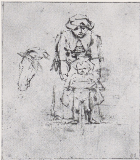
Afb. 4. Rembrandt, 1656. Moeder en kind. Pentekening RP T-1955-40