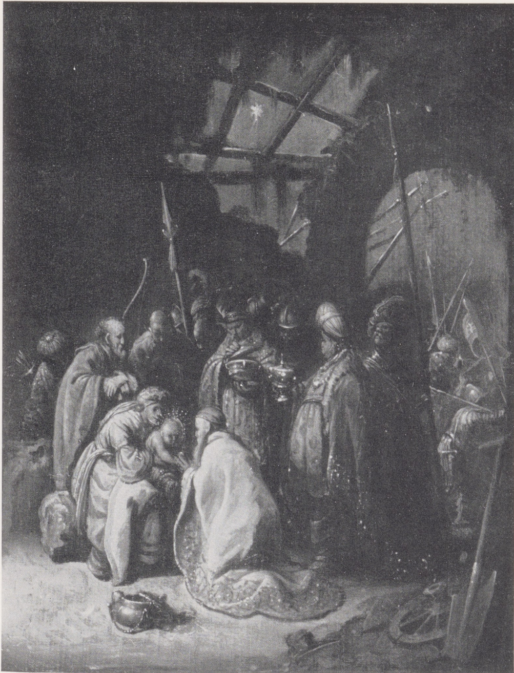
Afb. 2. Rembrandt, circa 1626-1631. De Aanbidding der Koningen. Schilderij in de verz. Heldring, Oosterbeek