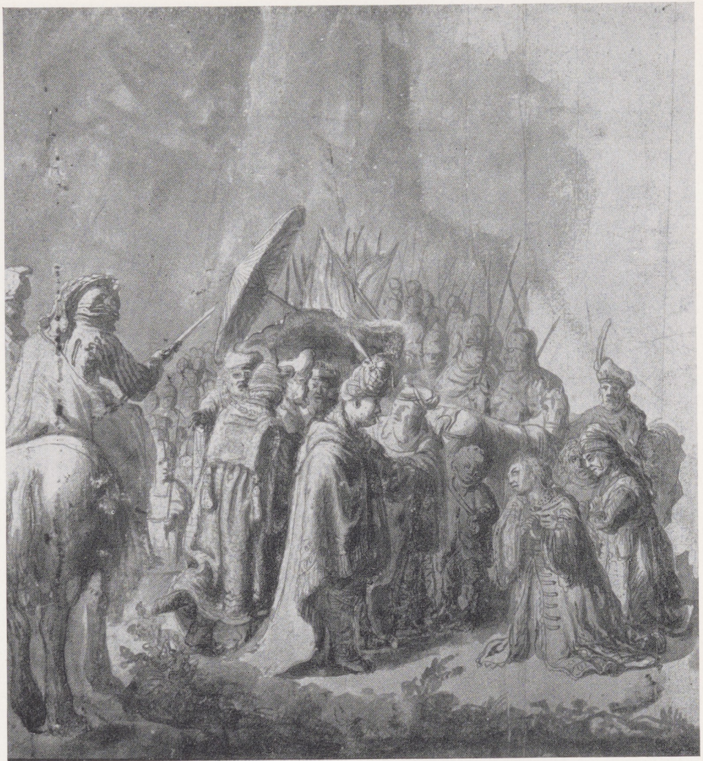
Afb. 3. Rembrandt, circa 1624-1626. Smeekebede gericht tot een veldbeer. Tekening in het Louvre