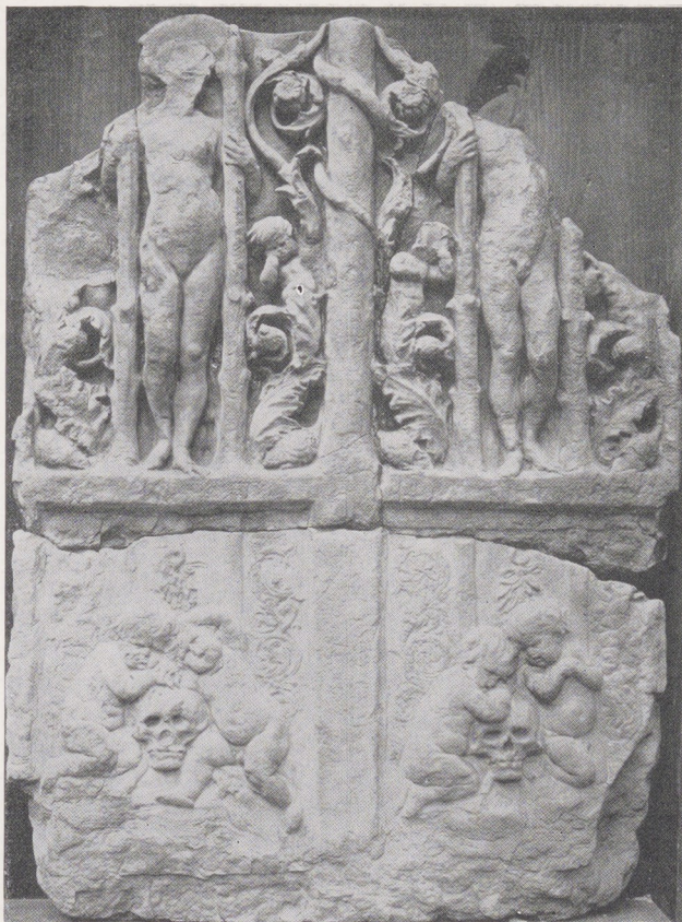
Afb. 1. Terracotta model voor deuren of luiken, Rijksmuseum, Amsterdam