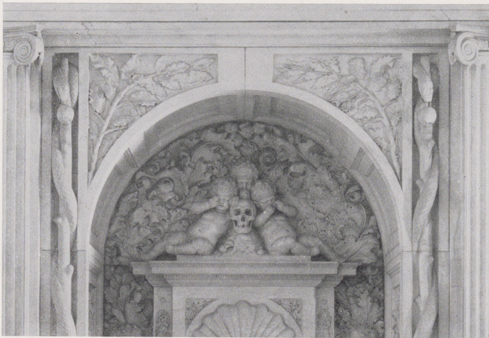
Afb. 3. Vierschaar van het Koninklijk Paleis, Amsterdam. De zetel van de secretaris (fragment) aan de Noordelijke muur