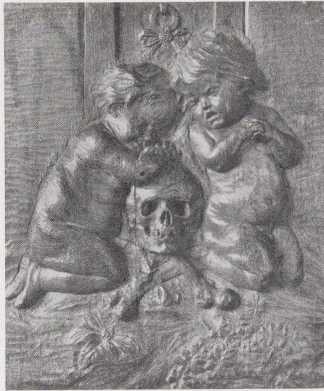
Afb. 2. Houten modellen voor deuren of luiken, Rijksmuseum, Amsterdam