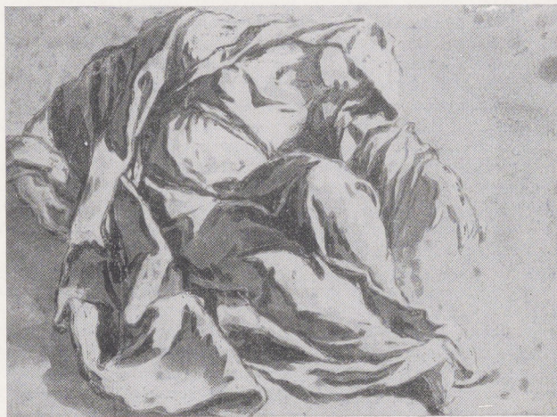
Afb. 5. Alessandro Magnasco, Maria aan de voet van het kruis (Penseel)