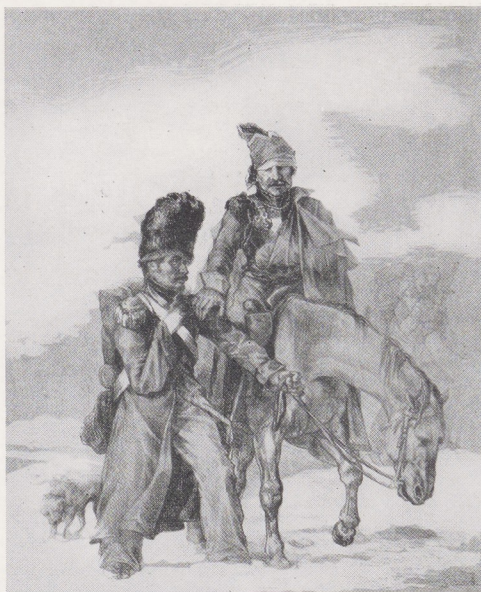
Afb. 6. J. L. A. Th. Géricault, Retour de Russie (Lithografie)

P. A. Martini naar J. M. Moreau, Exemple d'humani-