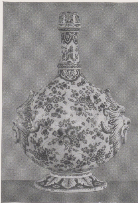
Afb. 3. Veldfles , Delfts aardewerk, monogram van Lambertus van Eenhoorn

Schotel met Wan-li decor. Noord-Nederlands aardewerk, tweede kwart XVIIIe eeuw. Schotel met Wan-li rand en veelkleurig plat. Noord-Nederlands aardewerk, omstreeks 1630-35. Schotel versierd met grotesken en bladranken in blauw. Noord-Nederlands aardewerk, omstreeks 1660. Twee grote vazen. Blauw Delfts aardewerk, tweede helft XVIIIe eeuw. Toegeschreven aan de monogrammist IW. Pruikenstandaard, twee kandelaars en twee tulpenhouders in de vorm van kinderen met een mand op het hoofd. Blauw Delfts aardewerk, einde XVIIIe eeuw. Gemerkt AK. Veldfles. Blauw Delfts aardewerk, omstreeks 1700. Gemerkt met het monogram van Lambertus van Eenhoorn. (Afb. 3) Twee messen met heften van veelkleurig Delfts aardewerk, omstreeks 1700. Twee ovale plaques met de portretten van Karel I en George I van Engeland. Blauw Delfts aardewerk, omstreeks 1720. Ronde terrine met deksel. Veelkleurig Delfts aardewerk, eerste kwart XVIIIe eeuw. Gemerkt met het monogram van Ary Jeronimus van der Kloot. Twee vazen en een plaque. Veelkleurig Delfts aardewerk, begin XVIIIe eeuw.