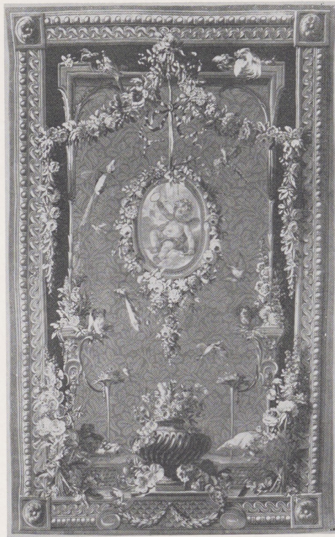
Afb. 4. Wandtapijt, Manufacture des Gobelins, omstreeks 1776

Kast van mahoniehout door Corinthische pilasters ingedeeld en door een tympanum bekroond. Op de deuren bladmotieven. Afkomstig van een verzamelaar van naturalia. Nederlands, omstreeks 1780.