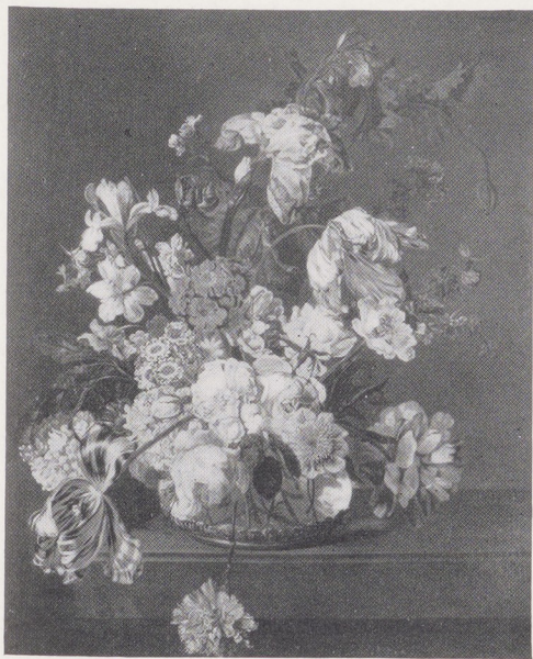
Afb. 1. Cornelia van der Mijn , Bloemenstillevens , 1762

Jean-Baptiste Greuze (1725-1805), Portret van Mar- quis de Saint Paul.