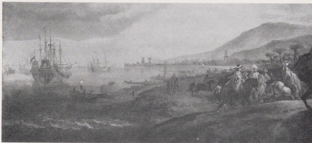
Afb. 3. Détail van Weenix' schilderij: de blokkade van Goa; links de „Uytrecht“