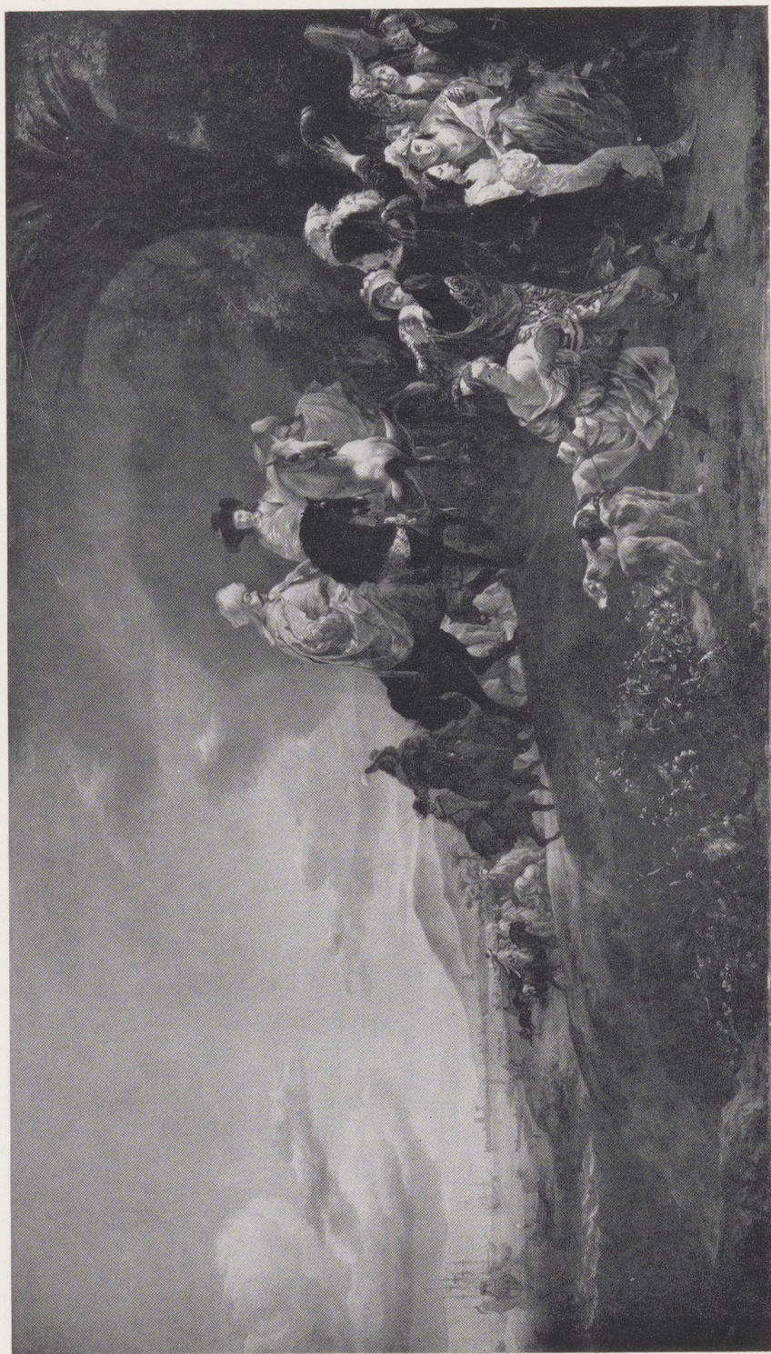
Afb. 1. J. B. Weenix, Johan van Twist en de blokkade van Goa . Doek, 104 x 182 cm