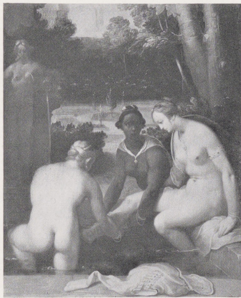
Afb. 1. Cornelis van Haerlem, Bathseba in het bad, 1593