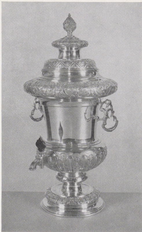
Afb. 2. Bouilloir door Andele Andeles, Leeuwarden 1729