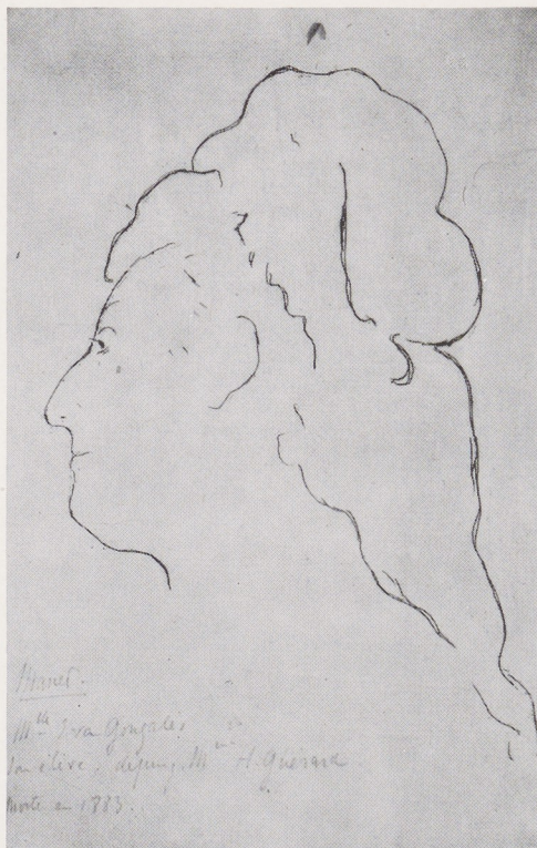
Afb. 6. E. Manet, Eva Gonzales. Ets.