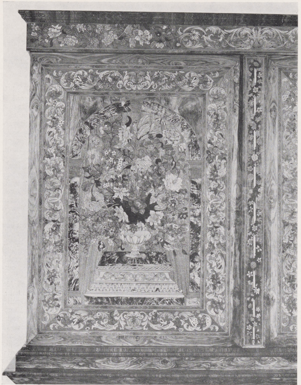
Afb. 1. Detail van de voorzijde van het kabinet