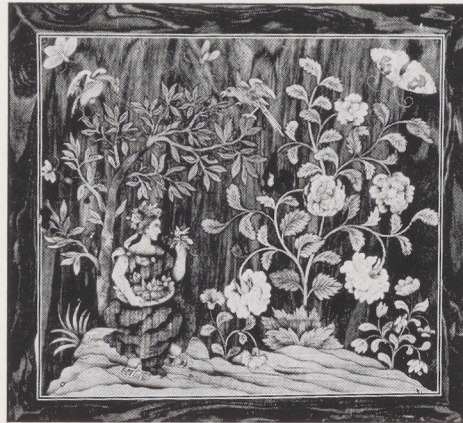
Afb. 5. Deurtje binnenin