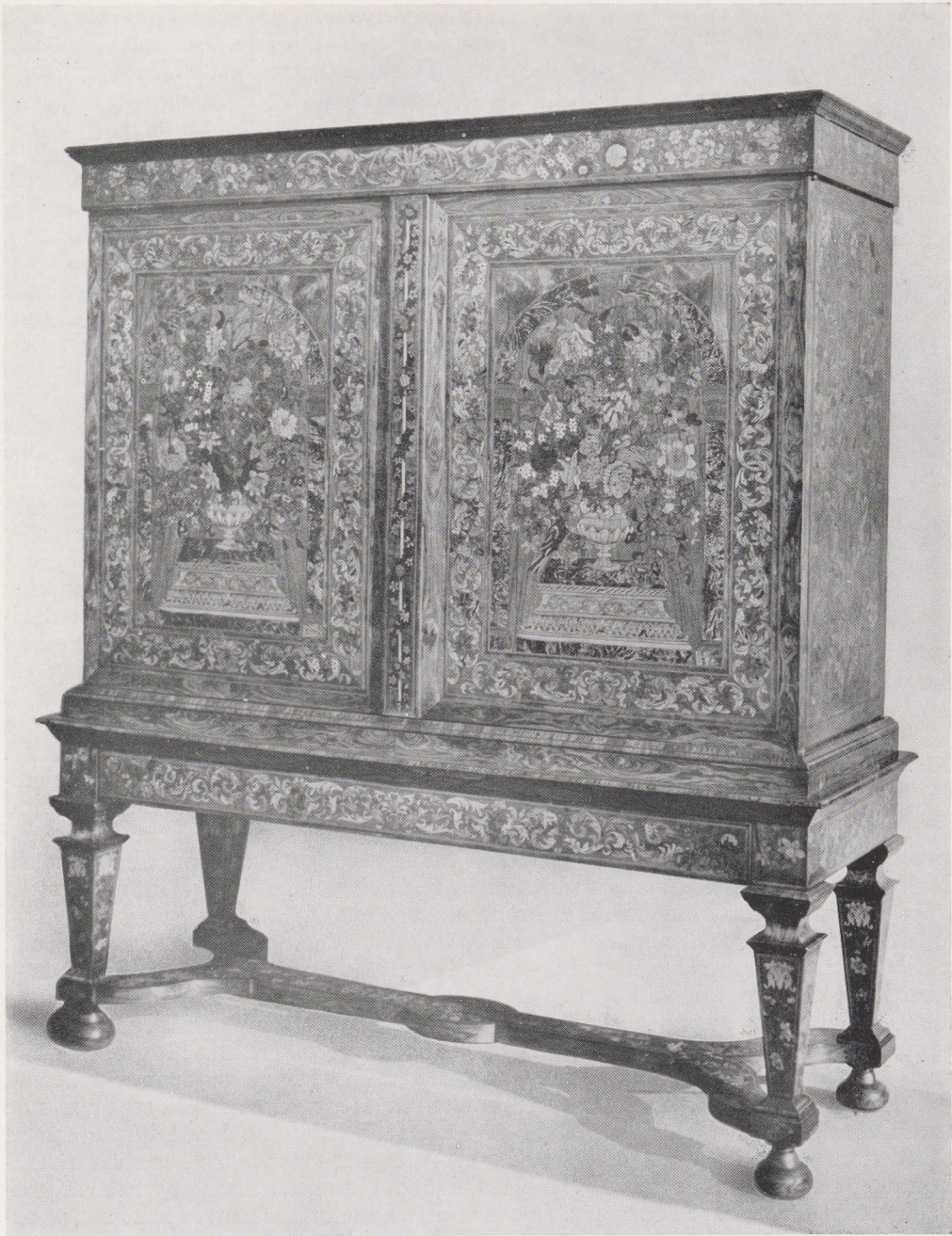
Afb. 2 Kabinet, Hollands werk, omstreeks 1700