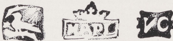
De merken van het zogenaamde keteltje

daarentegen karakteristiek Italiaans. Zij stellen gebaarde faunskoppen voor; de grote geopende monden verraden navolging van antieke toneelmaskers. De kloeke, doch nogal zware vorm van het geheel tenslotte past in het beeld der Zuid-Italiaanse kunst. Wat betreft de datering van het stuk het volgende: de mascarons, alsmede het klare, klassieke lettertype van de merken, tonen aan dat de lavabo in het begin van de XVIIe eeuw moet zijn vervaardigd. 't Was derhalve een nieuw, of althans een tamelijk nieuw voorwerp, dat de Turken in 1534 roofden.