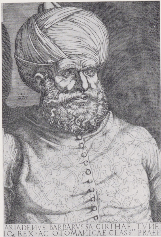
Chaireddin Barbarossa; gravure door Domenico Veneziano

toen hij, als echtgenoot van Maria van Bourgondië, over Gelre en Brabant tegelijk regeerde, in 1481 aan laatstgenoemd hertogdom gehecht. In 1485 werden de landen van Cuyk evenwel weer van Brabant afgescheiden; voortaan ressorteerden zij onmiddellijk onder de Habsburgse landsheer. Omstreeks 1519 zag Karel V zich uit geldgebrek genoodzaakt, Cuyk voor 20 000 gulden te verpanden aan Floris van Egmond, heer van Buren. Hij was de vader van Maximiliaan. Er schuilt dus niets vreemds in, dat deze bij zijn terugkeer in Patria op Allerkinderdag 1536 het in het heidense land veroverde kunstvoorwerp aan de stad Grave schonk. Het pand is in 1549 ingelost, doch Philips II moest, toen hij in geldverlegenheid verkeerde, andermaal de Cuykse heerlijkheid verpanden, nu voor 60 000. Pandnemer was toen de weduwnaar van Maximiliaan's enige dochter en erfgename, prins Willem I van Oranje. Het 'keteltje' bleef inmiddels op het stadhuis te Grave bewaard. Herhaaldelijk schonk men er de groten des werelds, die de stad