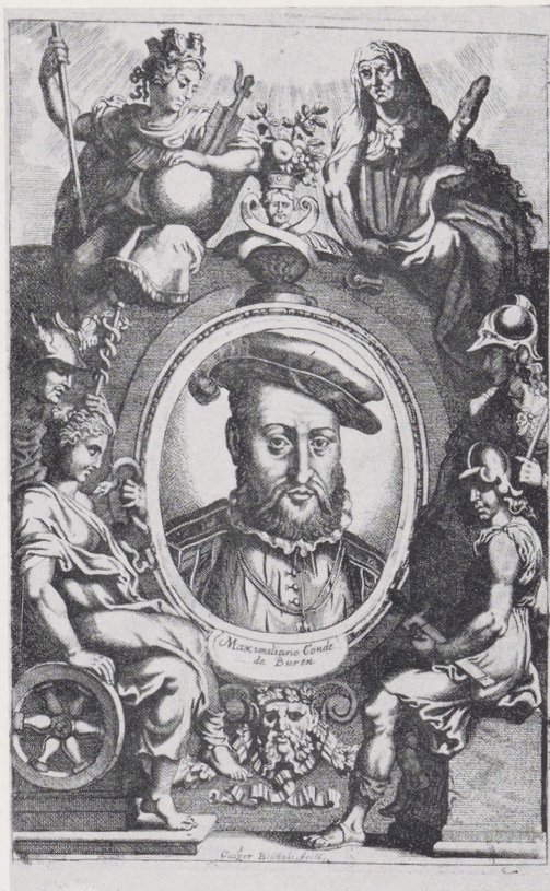
Maximiliaan van Buren; gravure door Caspar Bouttats

en zeker niet van dezelfde hand, die het opschrift aanbracht. Eerder zal het afkomstig zijn geweest uit een van die Zuid-Nederlandse émailleurs-ateliers, die in de XVe en de vroege XVIe eeuw zulke voortreffelijke producten hebben afgeleverd 1 . Mogelijk had men te Grave dit schildje in voorraad; misschien is het afkomstig van een gesloopt object. Toen de tuit op de lavabo werd geplaatst, verstoorde die het goede evenwicht ervan. Het wapentje heeft de balans later vrijwel hersteld. Pit veronderstelde indertijd 2 , dat het 'keteltje' van Spaanse makelij was. Hij wist het merk van Napels nog niet te interpreteren. Uit het oogpunt van stijl bezien was zijn suggestie nog zo onjuist niet. Het koninkrijk Napels had gedurende de middeleeuwen nauwe relaties met Spanje gehad. Sedert 1504 behoorde het aan de kroon van Aragon. Dientengevolge was er met de koningen en onderkoningen een sterke invloed van de Spaanse kunst gekomen. In tegenstelling tot de Midden- en Noord-Italiaanse kunst was die van Spanje in het begin van de XVIe eeuw niet voorlijk. De gothiek was er nog niet geheel verdwenen. Men ziet dit in het onderhavige geval o.a. aan de geornamenteerde knop in het midden van het hengsel van de lavabo. De twee aardige mascarons aan de oren, waarin het hengsel scharniert, zijn