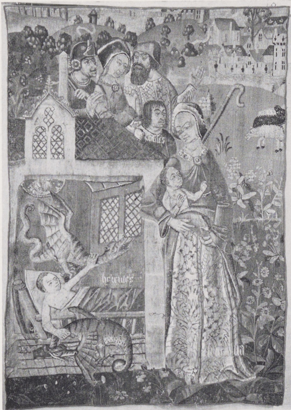
Afb. 3. Fragment I van het Hercules tapijt