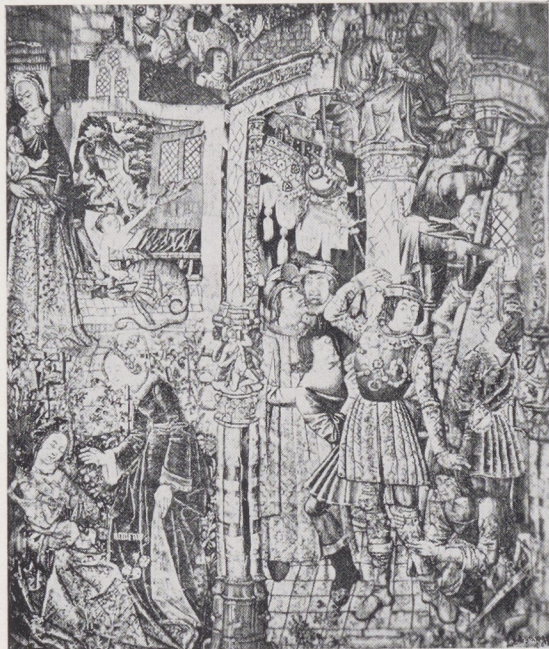
Afb. 1. Vroegere toestand van het Hercules tapijt (afbeelding uit de veilingcatalogus Heilbronner 1913)

gebracht in de compositie door middel van stukken 2 .