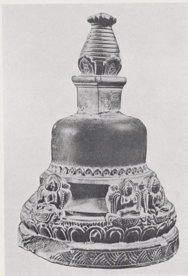
Nepalese stûpa

1 ) Bijgestaan door de archivaris van Doornik bracht mevrouw Crick in haar artikel van 1931 de als Linitins gelezen naam op Venitins. 2 ) Ph. Ackerman, The Ferrets and Poissonniers in Art in America , 1925, Jun, p. 191 en Aug., p. 266. Omdat zij hierin niet verwijst, doch alleen spreekt van een bij Drouot geveild Hercules tapijt, is het niet duidelijk of zij de veilingen van 1921 en 1922 bedoelt, dan wel die van 1913.