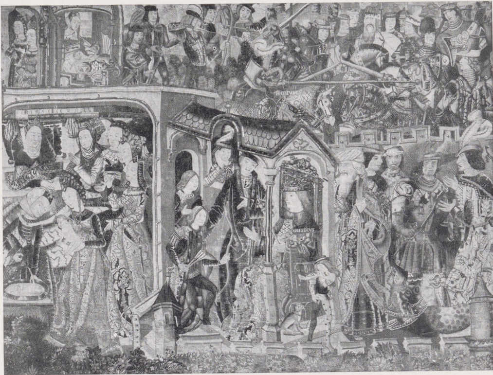
Afb. 4. Fragment van een Hercules tapijt

Brussel, Koninklijk Museum voor Geschiedenis en Kunst