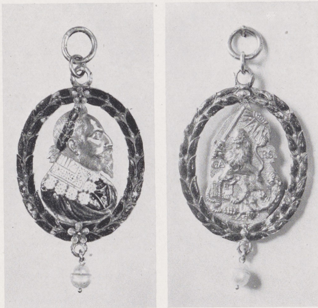
Afb. 1 en 2 Hanger in het Rijksmuseum (voor- en achterzijde)

Bovenaan is een draagring bevestigd, aan de onderkant hangt een parel, die zodanig bewerkt werd, dat de bovenste helft iets kleiner dan de onderste is geworden.