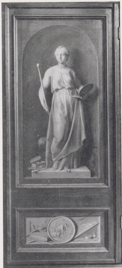
Afb. 1. Jacob de Wit, 'De Schilderkunst', 1750

De grote kunstkast van Joannes de Bosch was 'à l'antique' gewerkt, dat wil dus zeggen, uitgevoerd in de Hollandse Louis XVI stijl van omstreeks 1780. De Wit's paneel, dat 1750 gedateerd is, moet dan ook oorspronkelijk voor een ander kabinet bestemd geweest zijn. Wij menen ook dit te kunnen aanwijzen. In de verzameling van Pieter Locquet 2 , die in 1783 te Amsterdam geveild werd, bevond zich namelijk een 'Rariteitskast', die door Joannes de Bosch gekocht werd en voorzien was van zijdeuren, die aan de voorzijden in het grauw beschilderd waren met 'twee vrouwbeelden door de kunstige hand van Jacob de Wit'. Weliswaar worden in de catalogus van Locquet's veiling deze figuren als 'De Voorzichtigheid' en 'de Wijsheid' omschreven, maar dit zal men wel als een - opzichzelf in dergelijke geval-