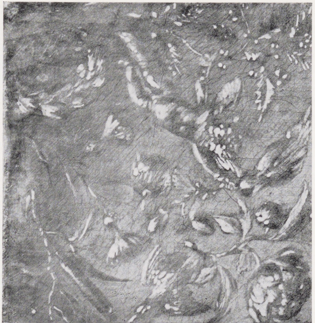
Afb. 2. Detail van Pieter de Hooch's 'Kaartspelers'