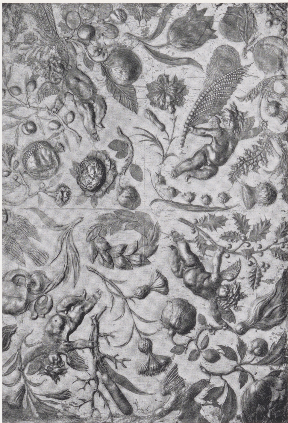
Afb. 1. Vel goudleer, Amsterdams werk, omstreeks 1660