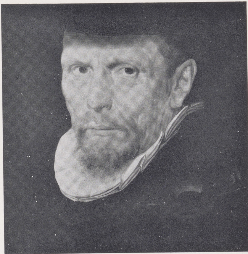
Pieter Pietersz., Detail uit de 'Staalmeesters der Lakenhal', Rijksmuseum Amsterdam

en luitenant Pieter Vinck (Rijksmuseum, cat. No. 1876) ondersteunt, naar ik meen, mijn zienswijze. Pieter Pietersz. werd in 1540 te Antwerpen geboren, in 1574 als schilder te Haarlem vermeld, in 1585 te Amsterdam, waar hij in 1603 is overleden. Van Mander schrijft over hem 'die een seer goet meester is gheweest / volgende seer 'de manier van zijn Vader / en Meester: doch veel hem tot conterfeyten nae't leven 'begevende / dewijl weynigh groote wercken binnen zijnen tijt voorquamen'. In de ogen van zijn tijdgenoot Van Mander begaf Pieter Pietersz. zich door het schilderen van portretten noodgedwongen op een zijpad der kunst. Dit waren immers geen 'groote wercken'. Het nageslacht verkiest echter die menselijke, realistische beeltenissen boven de manieristische composities uit diezelfde tijd. Meer dan tien jaren voor Frans Hals heeft Pieter Pietersz. een portret geschilderd met een zekerheid en durf, dat – zie ik het goed – een verrassing mag worden genoemd.